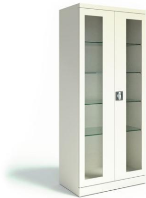
Szafa medyczna 1 drzwiowa